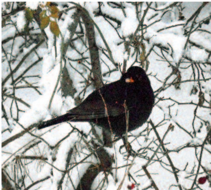
Csak a feketerigó maradt feketének

Időben távolabb, térben közelebb, Brassóban folytatjuk szeszélyes sétánkat. 469 éve, 1549. január 23-án tért meg teremtőjéhez Johannes Honterus humanista gondolkodó, geográfus. 1530-ban adta ki első földrajz-ég-leírását, a Cosmographiát . Bázelen 1532-ben elkészítette Dél-Erdély első részletes térképét, majd Albrecht Dürer rajzai nyomán fába metszette az első, modern szemléletű áttekintő égbolttérképet. 1533-ban hazatért Brassóba, s a reformáció lutheri irányzatának megerősítését, a fiatalág nevelését, a széles körű műveltség terjesztését tűzte ki céljául. Brassóban adta ki bővített geográfiai munkáját Rudimenta Cosmographica címmel, amelyhez 13 saját szerkesztésű térképet csatolt. A mű másfél évszázad alatt 39 kiadást ért meg, a legkülönbözőbb európai nyomdákban. Csillagterképét újranyomatva több munkához mellékeltek és másolták.