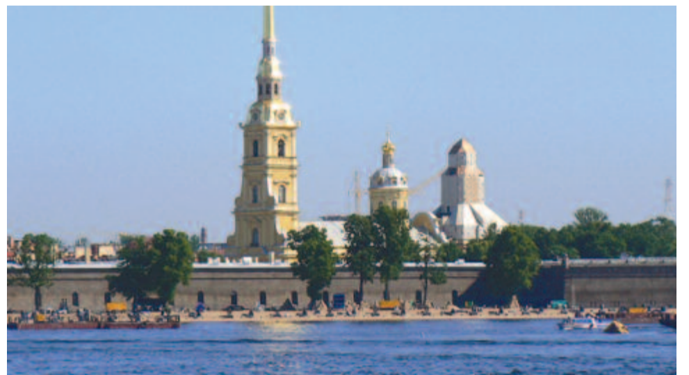
Péter-Pál-erőd és templom, Szentpétervár

Nagy Péter cár jelentéktelen, kis lakóháza a Néva folyó partján épült, egyike az első épületeknek Szentpéterváron, a Péter-Pál-