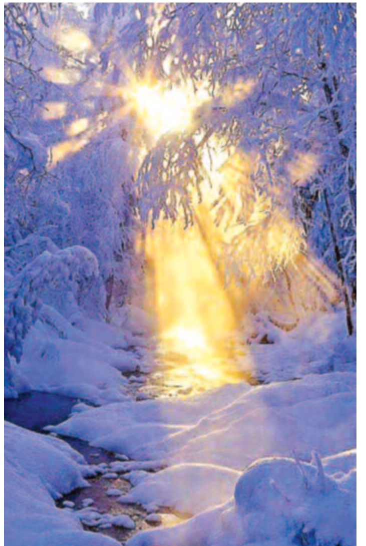
Betemetett a nagy hó erdőt, mezőt, rétet

Egy kutya bíró eleibe idézte a juhót, Kinek kölcsön adott volna kenyéret, s ez hamis